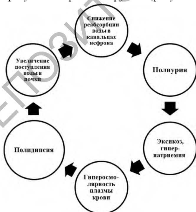
Рисунок 1 – Механизм развития изменений при несахарном диабете

Патогенез. Механизм развития изменений при несахарном диабете характеризуется «порочным кругом» (рисунок 1).