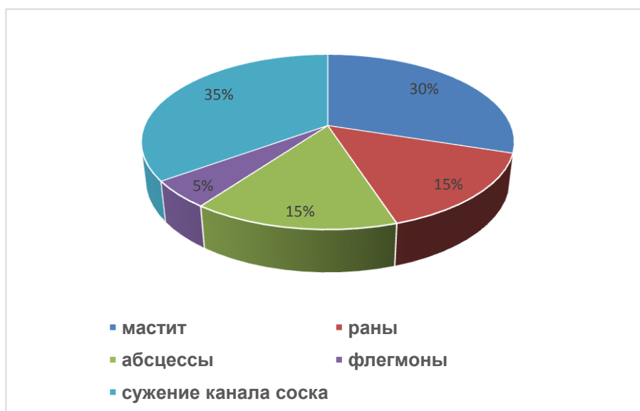
Рисунок – Соотношение болезней молочной железы у коров в период 2018–2019 гг.

Коровам опытной группы для лучшего размягчения рубцовой ткани применяли аппарат вихревой имплозионной физиотерапии «Вихрь-9Т» с катушками Мишина, воздействуя переменным электростатическим полем на верхушку сосков.