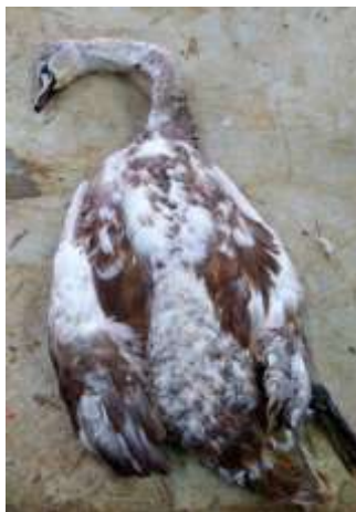
Рисунок 1 – Внешний вид трупа лебедя-шипунa. Макрофото

Депарафинирование и окрашивание гистологических срезов почек проводили с использованием автоматической станции «MICROM HMS 70». Гистологические исследования проводили с помощью светового микроскопа «Биомед-6» [8]. Полученные данные документированы микрофотографированием с использованием цифровой системы считывания и ввода видеоизображения «ДСМ-510», а также программы «ScorePhoto» с соответствующими настройками для проведения морфометрического анализа.