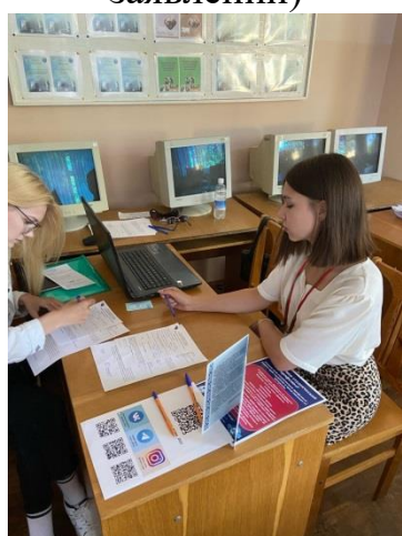
Рисунок 3 – Работа волонтеров Штаба (проведение анкетирования)