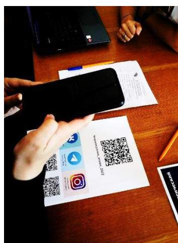
Рисунок 4 – Волонтеры Штаба представляют информацию о социальных сетях академии