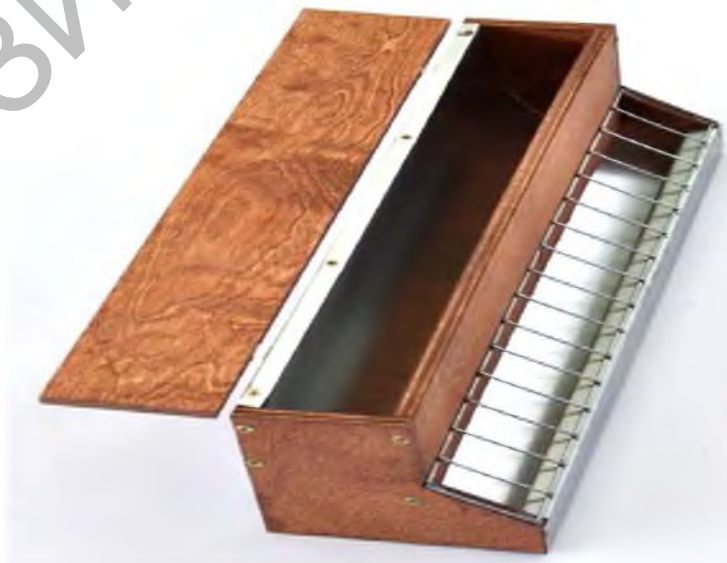
Рисунок 3 – Бункерная кормушка для концентрированных кормов (

Бункерная кормушка представляет собой емкость, передняя стенка которой, выполнена в виде решетки с шириной просвета не менее 10 см, задняя стенка сплошная. Между передней и задней стенкой внутри находится площадка из дерева или металла, имеющая наклон, по которому корм будет направляться к решетчатой части (рис. 3).