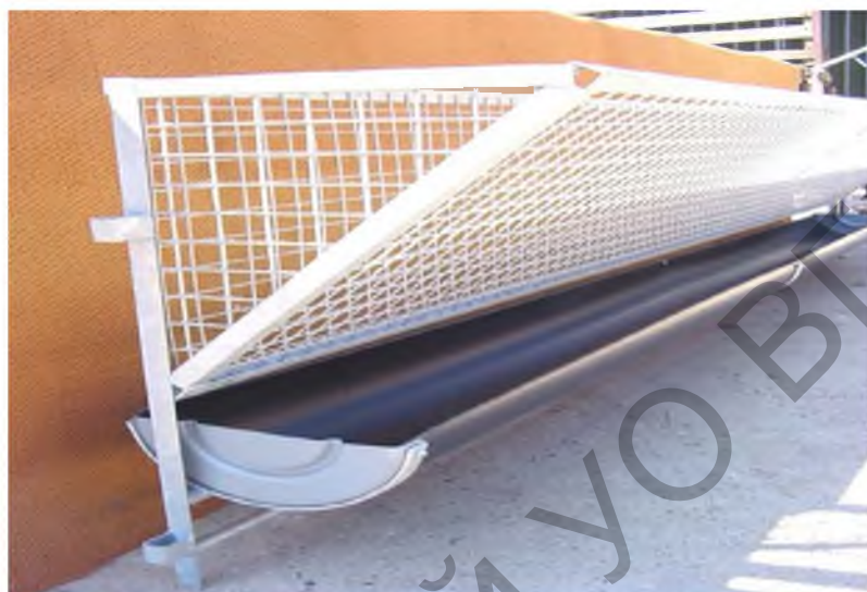
Рисунок 4 – Комбинированная кормушка односторонняя ( grounde.ru )

Кормушка комбинированная – представляет собой кормушку-ясли с решеткой на ножках до 35 см, высотой решетки – до 50 см, ширина желоба для концентрированных кормов по верху – до 17 см, по низу – до 15 см при глубине до 12 см (рис. 4). Кормушки комбинированные бывают одно- и двухсторонние.