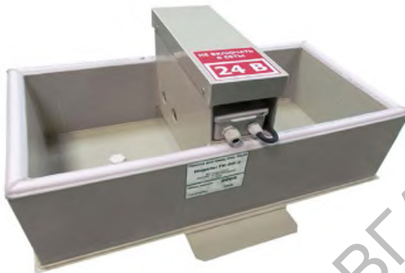
Рисунок 6 - Групповые обогреваемые автоматические поилки для овец и коз ГК-ОК-2 ( https://agroservers.ru )

Для поения животных в зимнее время в помещениях и на базах устанавливают автопоилки с электроподогревом воды до 20°C (рис. 6).