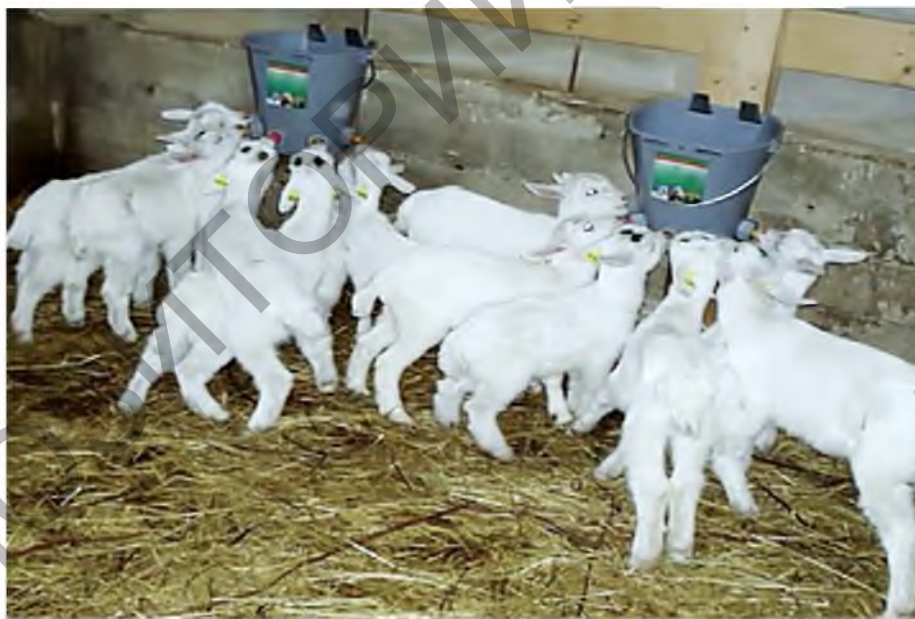
Рисунок 7 – Групповая сосковая поилка для козлят

Для поения козлят групповые секции оснащают сосковыми поилками, обеспечивающими одновременное поение пяти и более козлят (рис. 7).