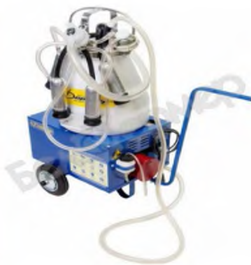
Рисунок 9 – Передвижной доильный аппарат АД-02 СК (zernomol.by)

Преимуществом машинного способа доения является то, что доильные аппараты фиксируют животное, сдаивают молоко до последней капли, при помощи аппаратного доения можно за час обработать до 20 козочек.