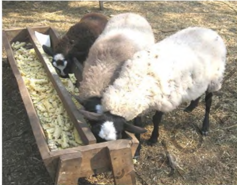
Рисунок 2 – Кормушка для концентрированных кормов – рештак ( goferma.ru )

Рештак - представляет собой корыто прямоугольной формы, выполненное из остроганных досок, установленное на стойках-ножках 30-40 см от земли до верхнего края. Ширина корыта по верху до 30 см при глубине до 12 см. Чтобы корм из рештака не вываливался, на стыке двух досок, образующих корыто, укладывают по всей длине рештака бруски в форме треугольника, основание которого образует дно корыта (рис. 2).