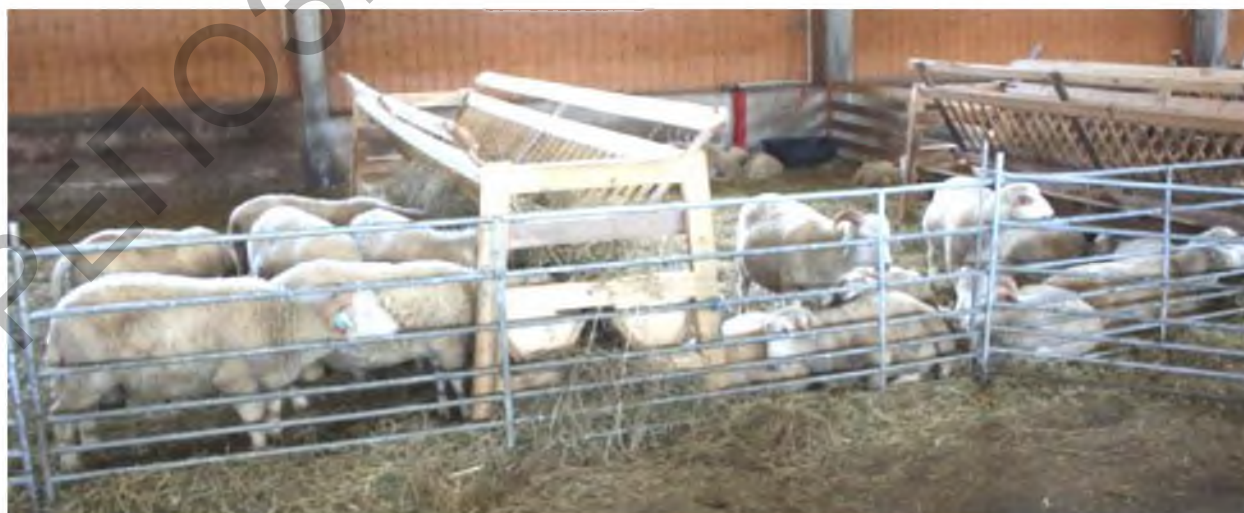
Рисунок 1 – Ясли – кормушка для грубых кормов

Ясли - представляют собой стойку, к которой крепится сплошное днище (чаще всего дощатое) и решетка. В решетке расстояние между планками составляет 10 см. По верху решетки над головой животного, для предотвращения засорения шерсти грубыми кормами, оборудуют сплошной козырек (рис. 1)