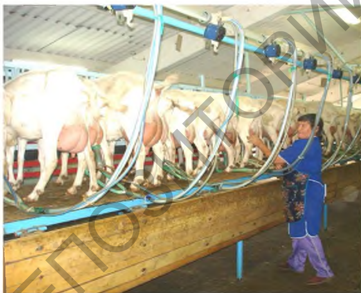
Рисунок 8 – Доильная установка для доения коз «Параллель»

Гигиена доения коз. В промышленном козоводстве в стойловый период коз доят машинным способом в доильных залах с применением установок типа «Карусель» и «Параллель» (рис. 8), а в пастбищный период и в небольших фермерских хозяйствах – при помощи передвижных доильных аппаратов в загонах (рис. 9).