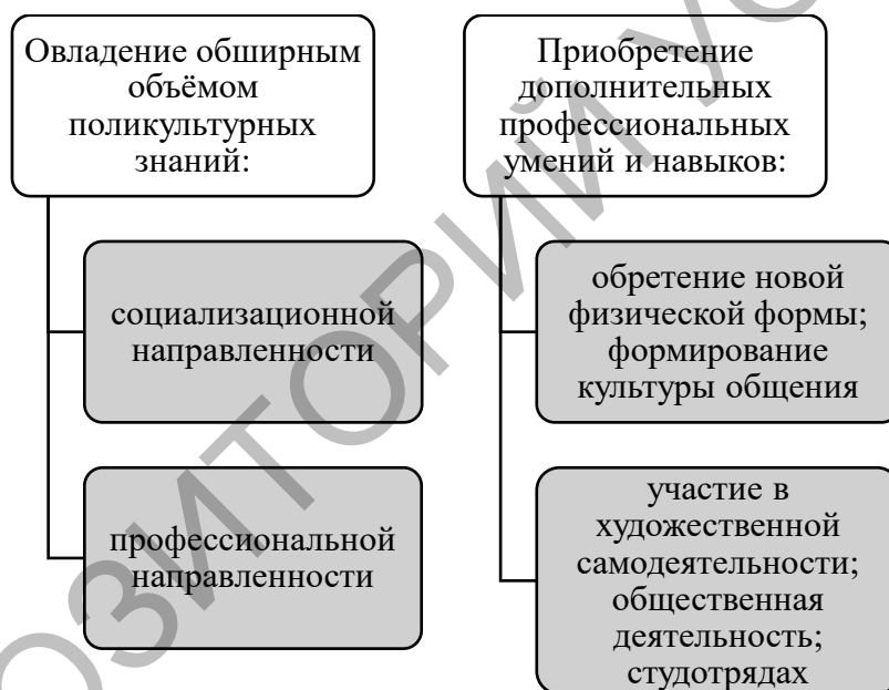
Рисунок 1 – Важнейшие элементы социокультурной деятельности студентов

Введение. Практически всё остальное время, которое не подчинено учебно-воспитательному процессу студентов в вузе может быть рассмотрено с точки зрения и позиции социокультурного времени, используемого студентами по собственному усмотрению и, часто направляется оно (время – на процесс социокультурной деятельности) в дополнительное развитие личности. При этом фактическое духовно-нравственное и профессиональное социокультурное формирование личности конкретного молодого человека представляется по следующим направлениям (рисунок 1) [1–4].