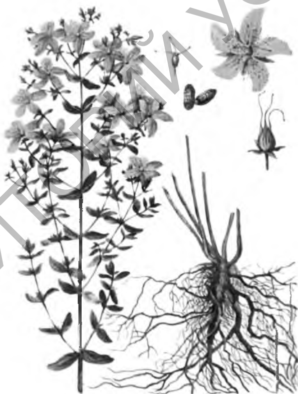
Рисунок 1 - Зверобой продырявленный ( Hypericum perforatum )

Зверобой ( HYPERICUM PERFORATUM L. ) - сем. Зверобойные - Guttiferae . Многолетнее травянистое растение. Из тонкого ветвистого корневища вырастает ежегодно несколько ветвистых стеблей с двумя гранями (рисунок 1).