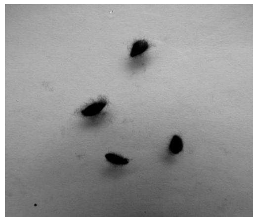
Рисунок 2 - Сапролегния, выращенная на субстрате, после обработки образцом дисперсии нольвалентного серебра без стабилизатора