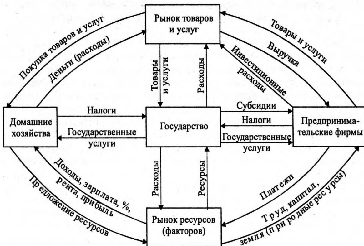
Рисунок 1 – Кругооборот ресурсов, товаров, услуг и денег (Источник – [9])

Функционирование национальной экономики можно проследить на рисунке 1.