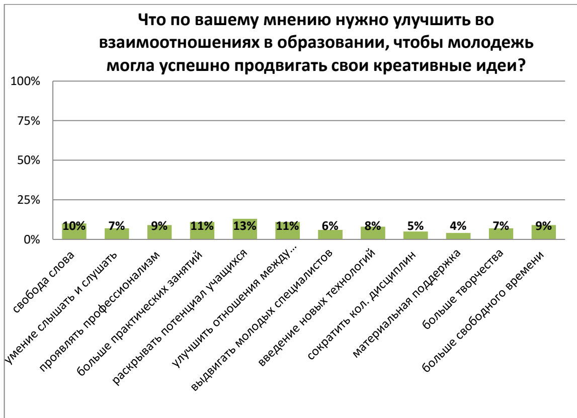
Рисунок 4. – Результаты анализа ответов на вопрос 4 анкетирования