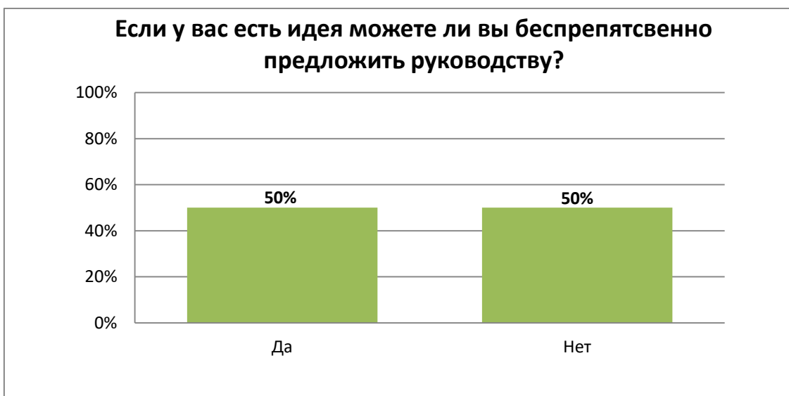
Рисунок 2. – Результаты анализа ответов на вопрос 2 анкетирования