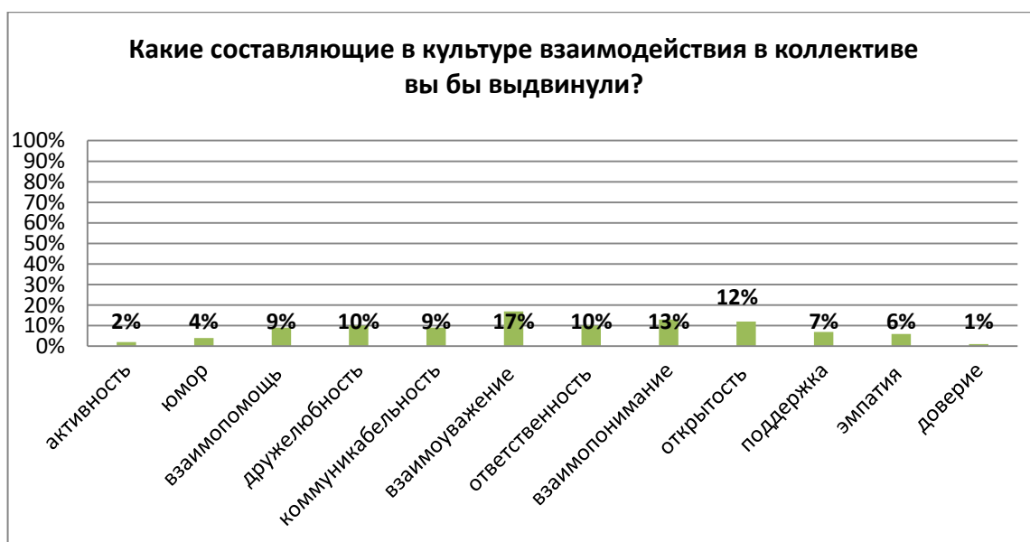
Рисунок 5. – Результаты анализа ответов на вопрос 5 анкетирования

Представленные результаты показали, что в целом у молодежи имеется задел к активному лоббированию собственных планов, однако недостаточно уверенности в результативности данных устремлений, как собственно и недостаточно уверенности в самих идеях. Несмотря на реальную энергетику молодых, в студенческие годы их «культурная креативность» требует педагогической поддержки в виде усиления практико-ориентированности образования в направлении формирования умения грамотно формулировать и презентовать свои идеи. Акцент молодежь делает на усиление взаимоуважения в процессе коммуникаций, что собственно говорит не столько о самой партисипативности, сколько ее культуре.