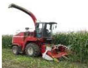
Рис. 2.2.4. Комбайн кормоуборочный «Полесье-800»

Уборку силосных культур следует осуществлять прямым комбайнированием (рис. 2.2.4).