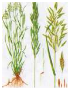
Кострец безостый [13]

Среднеспелые (кострец безостый, двухкосточник тростниковый, овсяница луговая, овсяница тростниковая, люцерна посевная, клевер гибридный, райграс пастбищный, лядвенец рогатый) (рис. 2.1.2).