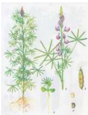
Рис. 4.2.3. Люпин [22]

Наиболее распространены три вида люпина: желтый, синий и белый. Из них сладкие сорта желтого и белого люпина содержат практически безопасное для животных количество алкалоидов – 0,002–0,12 %, горькие – до 3,87 % на сухую массу.