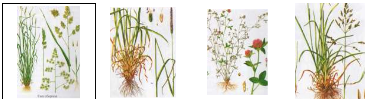
Ежа сборная [13]

Возделываемые в республике многолетние травы различаются по срокам созревания. Выделяют раннеспелые (ежа сборная, лисохвост луговой, клевер луговой, мятлик луговой), рис. 2.1.1.