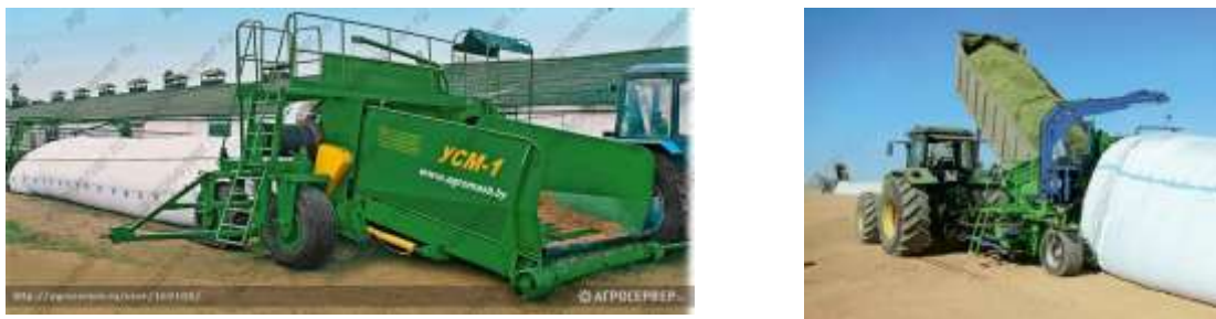
Рис. 2.2.8. Пресс-упаковщик УСМ-1 и силосование кормов в полимерный рукав

В условиях РБ наиболее приемлема закладка измельченного силосного сырья в крупногабаритный полимерный рукав (рис. 2.2.8).