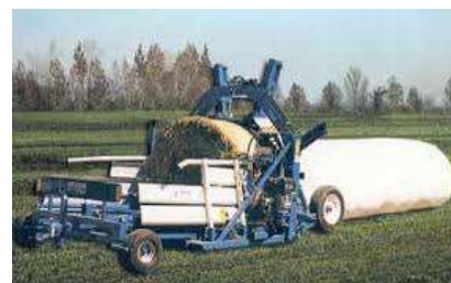
Рис. 3.2.10. Упаковщик и упаковка рулонов сена в полиэтиленовые рукава УПР-1