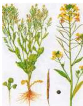
Рапс озимый [22]

Кроме того, иногда в практике используют крестоцветные культуры (рапс, сурепица и др.), амарант, мальву и др. (рис. 2.2.3)