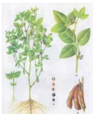
Рис. 4.2.4. Соя [22]

Соя – одно из лучших кормовых белковых растений (рис. 4.2.4).