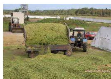
Рис. 2.2.5. Транспортировки сырья к хранилищу и разгрузка [57]

Основным типом хранилищ для силоса остаются пока траншеи – наземные, полузаглубленные и заглубленные (рис. 2.2.6).