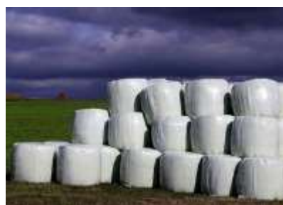
Рис. 3.1.3. Сенаж в упаковке

Складирование и хранение рулонов имеет свои особенности. Обмотанные рулоны немедленно устанавливаются в вертикальное положение, так как процесс ферментации корма начинается быстро. Вертикальное положение рулонов объясняется более плотной упаковкой торцевых поверхностей (рис. 3.1.3).