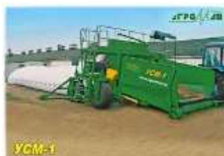
Рис 3.1.4. Упаковщик силосно-сенажной массы УСМ-1

В белорусских условиях наиболее приемлем способ заготовки – закладка измельченной кормовой массы в крупногабаритный полимерный рукав с помощью пресс-упаковщика. Провяленные травы подбираются самоходным комбайном, измельчаются и подаются в транспортные средства для доставки к месту закладки на хранение. Здесь масса выгружается в приемный бункер пресс-упаковщика и нагнетается им в полимерный рукав (рис. 3.1.4; 3.1.5).