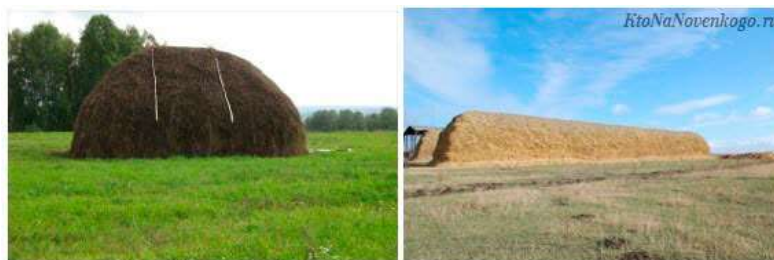
Рис. 3.2.3. Скирда [57]

В копнах сено досушивают до влажности 20–22 % и перевозят к месту для скирдования или стогования (рис. 3.2.3).