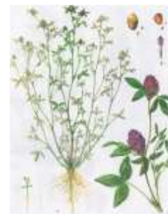
Клевер луговой [22]