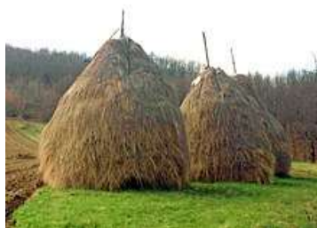
Рис. 3.2.4. Стог [57]

На отдаленных мелкоконтурных участках, где запас сена не очень большой, а возможности его транспортирования во время сеноуборки ограничены, сено на хранение укладывают в стога (рис. 3.2.4). Данный метод хранения наиболее приемлем для мелких и средних фермерских хозяйств.