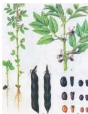
Рис. 4.2.5. Кормовые бобы [22]

Кормовые бобы (рис. 4.2.5). По содержанию протеина (24–28 %) и лимитирующих кислот бобы превосходят горох. В 1 кг зерна 10,8–12,4 МДж обменной энергии, 227 г переваримого протеина, 16,2 г лизина.