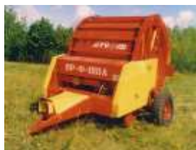
Рис. 3.2.7. Рулонный пресс-подборщик ПР-Ф-180

Наиболее прогрессивной технологией заготовки сена является его прессование в рулоны. Применение рулонных (в частности крупнорулонных) пресс-подборщиков (рис. 3.2.7) снижает себестоимость заготовки кормов и полностью решает проблему механизации подбора, транспортировки и укладки рулонов на хранение.