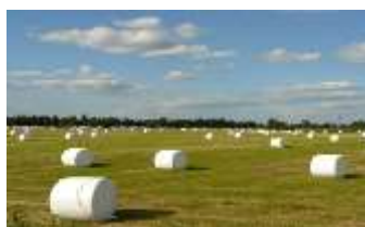
Рис. 3.2.9.Прессованное сено, упакованное в пленку

Одним из достоинств этой технологии является то, что каждый рулон корма обмотан (упакован) в полиэтиленовую пленку и представляет собой герметичное мини хранилище (рис. 3.2.9), а это обеспечивает выемку корма рулон за рулоном для скармливания без вторичной ферментации корма, т.е. без порчи его при нарушении герметичности траншей.