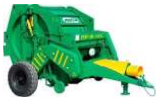
Рис. 3.1.1 Рулонный пресс ПР-Ф-145

Технологический процесс заготовки сенажа в рулонах включает кошение трав, провяливание и ворошение скошенной массы, формирование валков, прессование массы в рулоны, транспортировку рулонов к месту складирования, упаковку рулонов в специальную пленку и складирование рулонов (рис. 3.1.1; 3.1.2).