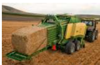
Рис. 3.2.6. Крупнопакующий пресс-подборщик

Из валков сено влажности 20–22 % подбирают и сразу же прессуют в тюки пресс-подборщиками с обвязкой тюков шпагатом (рис. 3.2.6).