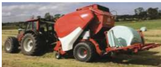
Рис. 3.2.8. Пресс-подборщик с упаковкой рулонов в пленку «Торнадо РППО 445»

необходимо загерметезировать специальной машиной (рис. 3.2.8) не позднее чем через 2–4 часа (соответственно при температуре воздуха 20,15 и 10 °С).