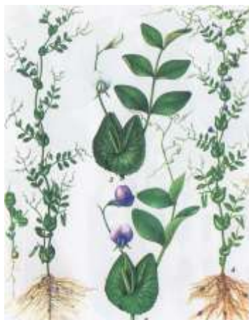
Рис. 4.2.1. Горох [22]

Горох. В Республике Беларусь зерно гороха является одной из наиболее распространенных и широко используемых высокобелковых культур (рис. 4.2.1).