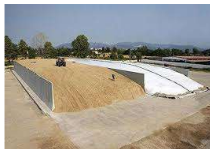
Рис. 2.2.6. Типы силосных траншей [57]

Перед загрузкой силосной траншеи ее необходимо очистить, отремонтировать и дезинфицировать, а дно должно быть выстлано соломой или качественной пленкой. Подъездные пути к силосной траншее должны