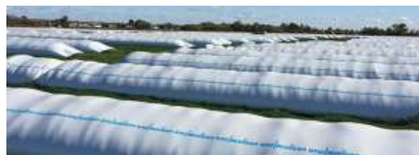
Рис 3.1.5. Хранение сенажа

Вся техника, необходимая для реализации данных технологий, выпускается в Беларуси: пресс-подборщики, обмотчики рулонов, упаковщики рулонов и зеленой массы в рукав, а также комбинированные машины, которые могут подбирать травы, формировать рулоны и обматывать их стрейч-пленкой. Производство полимерных рукавов осваивает ОАО «Борисовский завод пластмассовых изделий».