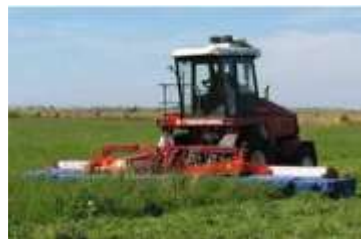
Косилка-плющилка широкозахватная КРН-9 с УЭС-2-250 Рис. 3.2.2. Укладки скошенной массы в расстил

Установлено, что валки массой 8–10 кг/п.м сохнут в 3–4 раза дольше в сравнении с массой, уложенной в прокос. Поэтому при заготовке сена на участках с урожайностью зеленой массы более 150 ц/га следует производить скашивание травостоя в расстил. Участки с урожайностью зеленой массы 120 ц/га и менее необходимо скашивать в валки.