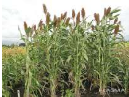
Рис. 2.2.2. Сорго сахарное [57]

Кроме того, иногда в практике используют крестоцветные культуры (рапс, сурепица и др.), амарант, мальву и др. (рис. 2.2.3)