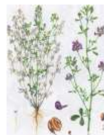
Люцерна посевная [22]