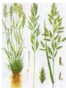
Овсяница луговая [13]