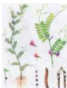
Рис. 4.2.2. Вика [22]

Вика (рис. 4.2.2). Целесообразным является использование любого источника белка, способного покрыть его недостаток в рационах сельскохозяйственных животных.