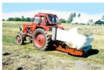
Рис. 3.1.2. Обмотчик рулонов ОР-1