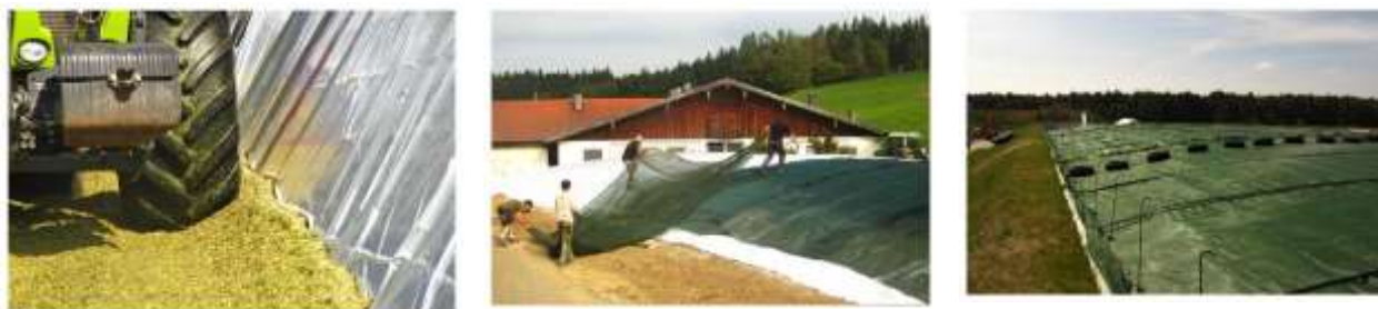
Рис. 2.2.7. Укрытие силосных траншей

Защитить силос от воздействия воздуха и влаги поможет система укрытия силосохранилищ. В практике чаще всего силос портится по краям траншеи. Поэтому имеет смысл выстилать стены пленкой и натягивать ее на «борта» траншеи (рис. 2.2.7).