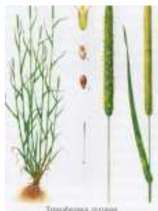
Тимофеевка луговая [22]

Позднеспелые многолетние травы (тимофеевка луговая, полевица белая, клевер луговой одноукосный, мятлик болотный) (рис. 2.1.3).