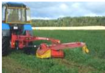
Косилка-плющилка навесная КРН-3,1 Рис. 3.2.1. Укладки скошенной массы в валок

Существенное влияние на условия сушки трав оказывает способ укладки скошенной массы – в валок или расстил (рис. 3.2.1, 3.2.2).