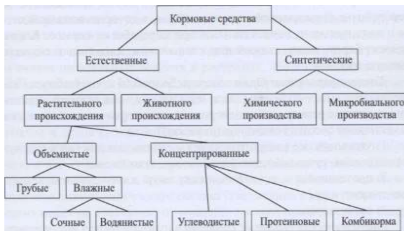
Рис. 1.1. Классификация кормовых средств

др.). Такая группировка необходима для решения организационных вопросов, планирования кормовой базы, использования кормов. Особое значение классификация кормов и их кодирование приобретают при использовании математических методов и компьютеров в вопросах планирования кормовой базы и организации кормления сельскохозяйственных животных.