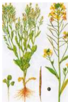
Рис. 4.2.6. Рапс озимый [22]

Рапсовое семя (рис. 4.2.6). В последние годы рапс приобретает все большее распространение как масличная культура и как белковый корм для всех сельскохозяйственных животных, особенно свиней.