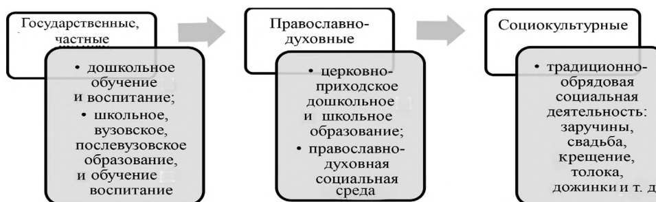
Рис. 1. Взаимодействующие организационно-структурные направления формирования непрерывно образовательной среды в сельской местности 1