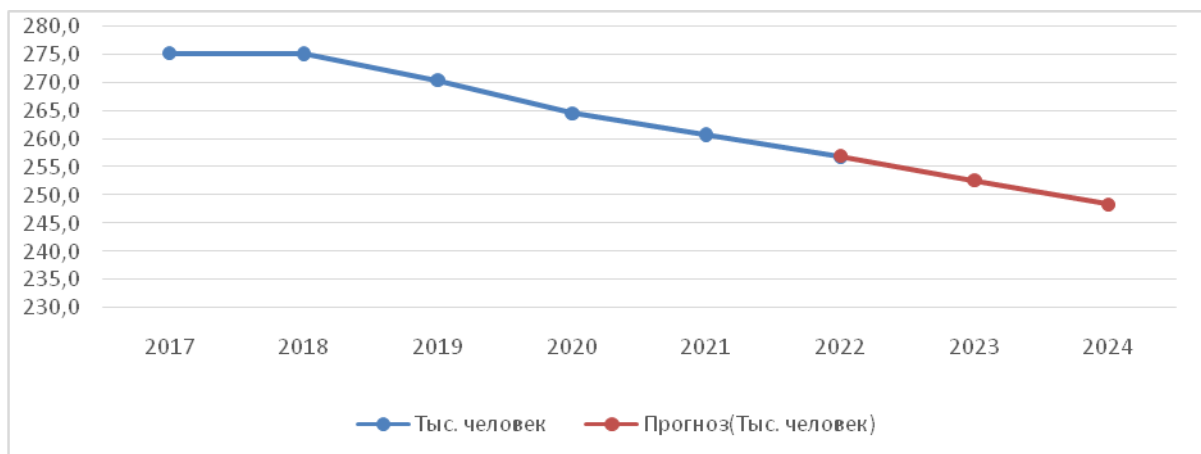
Рисунок 1 – График численности занятых на транспорте и прогноз по тренду