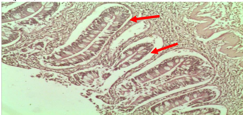
Рис. 3. Кишечные крипты и однослойный призматический эпителий слизистой оболочки кишечника щуки. Гематоксилин-эозин. Микрофото. Ув.: \times 100 .

В слизистой оболочке, также отмечались структуры характерные и для тонкого кишечника млекопитающих, в частности кишечные крипты (рис. 3).