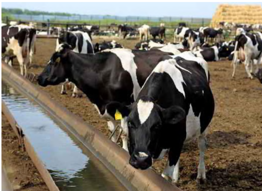
Рисунок 3 - Установка водопойных корыт при одностороннем поении

Размеры корыт: ширина по низу – 25-30 см, по верху – 35-40 см; глубина – 25-30 см. Длина водопойных корыт должна быть из расчета фронта поения: 0,75 м на голову – при одностороннем поении, 0,5 м на голову – при двухстороннем.