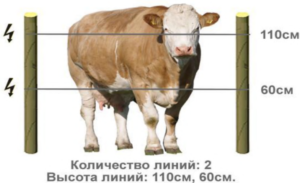
Рисунок 2 - Двухлинейная электроизгородь ( http://agroflot.ru )

Огораживание переносной электроизгородью проводят при помощи серийных электроизгородей – «электропастухов» (типа ИЭ-200, ЭК-1М, ГИЭ-1 и др.). Для ее установки используют однопроводный токоведущий провод диаметром 1,2 мм, изолированный от металлических стоек (рис. 2).