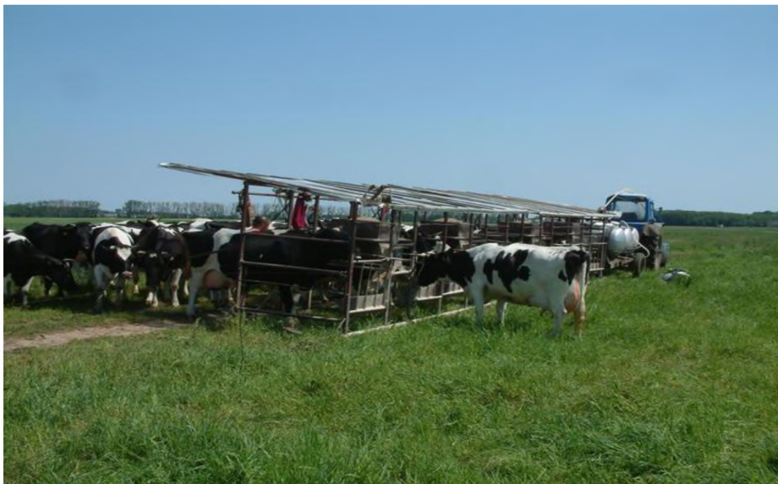
Рисунок 4 - Доение в условиях пастбищ

При круглосуточном пастбищном содержании скот находится на пастбище в течение суток, при этом доение производится на передвижных доильных установках (рис. 4).