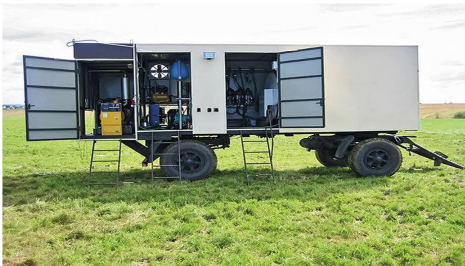
Рисунок 5 - Передвижная доильная установка УДП-12

Все отсеки изолированы, что помогает поддерживать чистоту в молочном блоке и положительно влияет на качество молока. Доильные аппараты, другое оборудование и расходные материалы между дойками хранятся в закрытом помещении, а не на открытом воздухе.