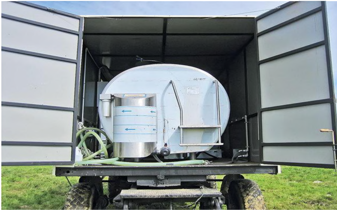
Рисунок 6 - Охладитель молока доильной установки УДП- 12 ( http://agriculture.by )

Передвижная доильная установка УДП-12 комплектуется стойловым оборудованием на 12 доильных мест, которые снабжены кормушками для раздачи концентратов, и имеет приспособления для одноэтапного перемещения в сцепке по пастбищу.