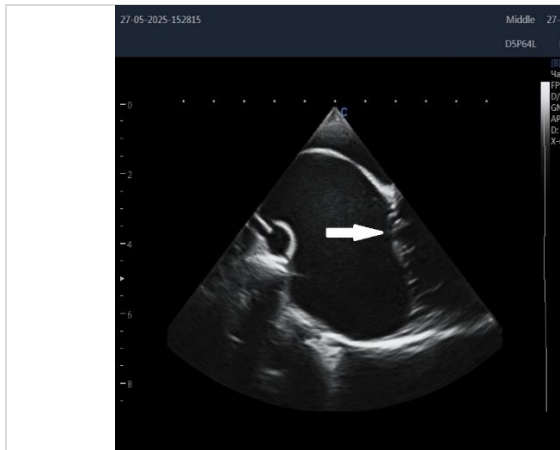
Рисунок 1 - Дилатация левого предсердия у собаки опытной группы, изменение морфологии и эхогенности клапана (показано стрелкой)