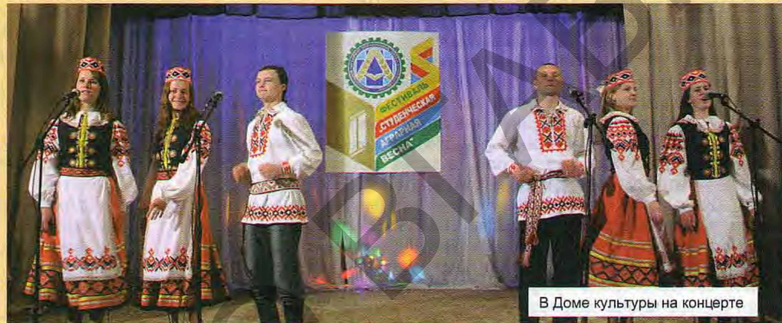
В Доме культуры на концерте

В фойе Дома культуры все желающие могли ознакомиться с экспонатами выставки научных достижений академии и многообразными творческими работами учащихся аграрного колледжа. В Книге отзывов записи благодарности, признательности, восхищения представленными материалами, работами, экспозициями.