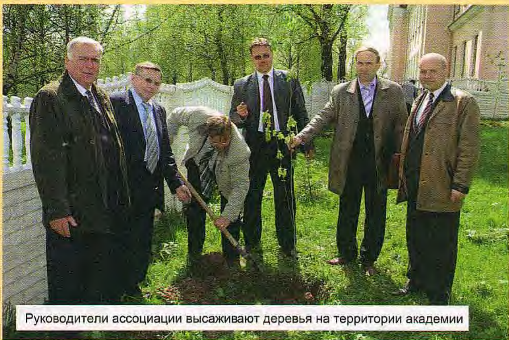
Руководители ассоциации высаживают деревья на территории академии