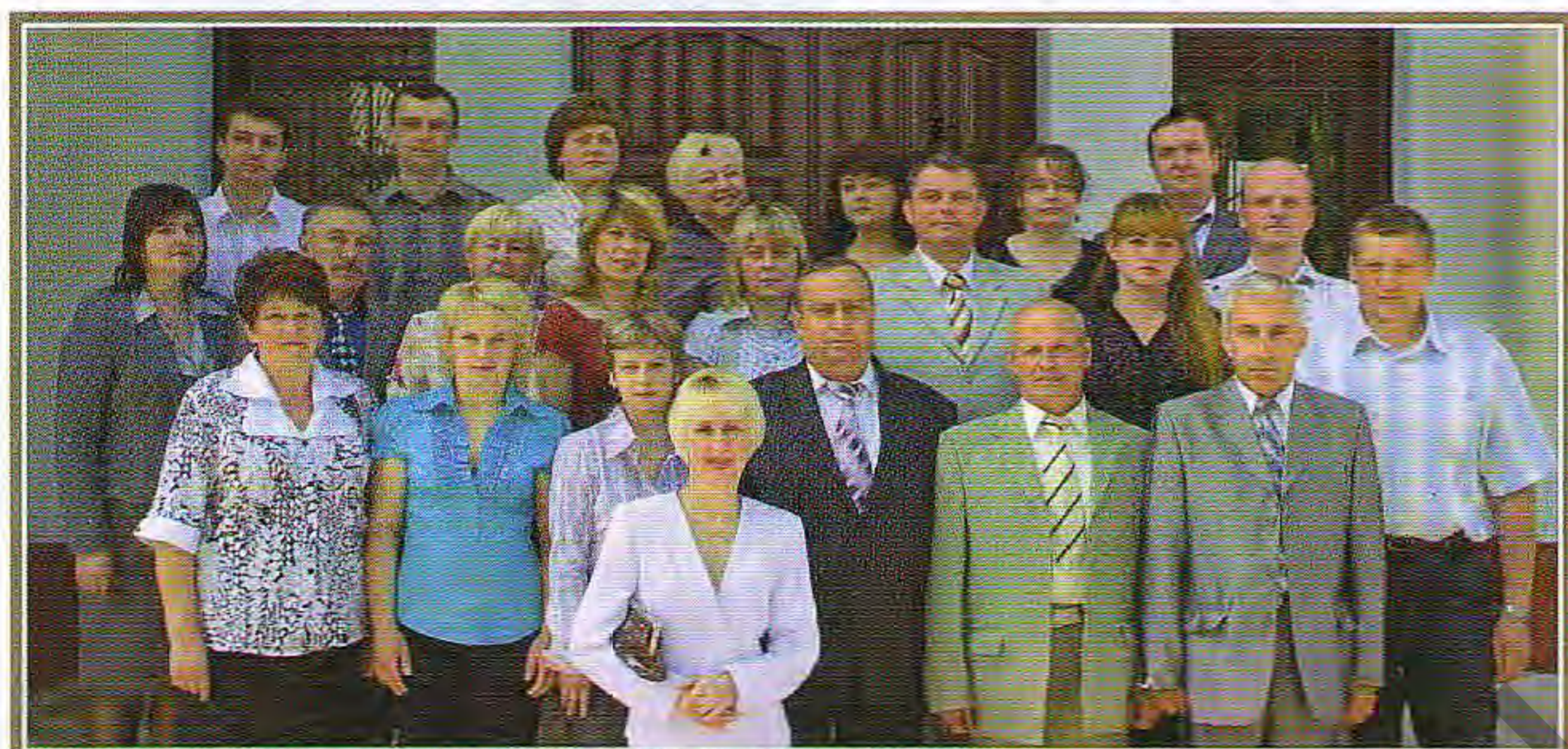
Первый выпуск ветеринарных врачей-патологоанатомов. 3 июня 2010 г.

первые 18 дипломов по специальности 1-74 03 76 «Ветеринарная патологическая анатомия». Такой выпуск был впервые проведен в Республике Беларусь и СНГ.