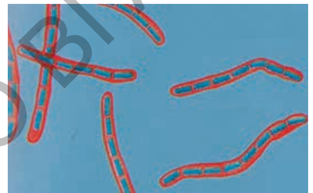
Рисунок 3 — Специфическое свечение сибиреязвенных бактерий, обработанных мечеными глобулинами преципитирующей сибиреязвенной сыворотки

Эпизоотологические данные. К СЯ восприимчивы животные многих видов, особенно копытные (22 вида). Восприимчивость животных к СЯ не зависит от резистентности организма восприимчивого животного, пола, физиологических и других особенностей организма. Возбудитель СЯ является облигатно (обязательно) патогенным микроорганизмом, и его попадание в организм, как правило, вызывает летальный исход. Вместе с тем наиболее восприимчивыми считаются домашние животные – крупный рогатый скот, овцы, буйволы, лошади, ослы, олени и верблюды. Менее восприимчивы свиньи, еще меньше восприимчива домашняя птица (только в эксперименте). Восприимчивость животных к СЯ коррелирует с температурой их тела: у птиц и свиней она самая высокая, а у крупного рогатого скота она самая низкая. В связи с этим крупный рогатый скот наиболее восприимчив к сибирской язве, а птица – только при экспериментальном ее заражении, при снижении температуры ее тела до 37-38 °С.