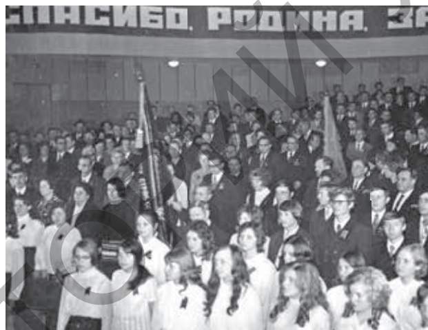
В зале торжественного собрания, посвященного 50-летию института и вручению ему ордена «Знак Почета». Драматический театр имени Якуба Коласа. 18.11.1974 г.