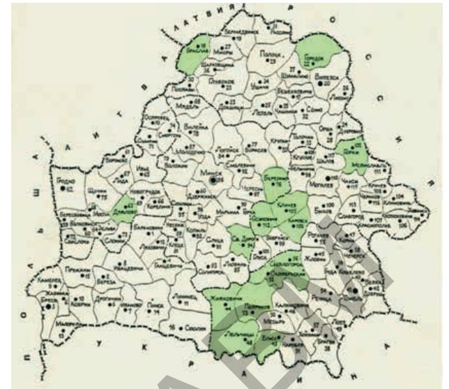
Рисунок 2 — Благополучные районы по сибирской язве в Республике Беларусь (■ выделены зеленым цветом на карте)

В организме больного животного и на питательных средах, содержащих сыворотку крови, возбудитель образует капсулу, а при доступе кислорода и неблагоприятных условий – споры. Споры обладают высокой устойчивостью к физическим и химическим факторам (в почве могут сохраняться до 85 лет и более). По устойчивости к химическим дезинфицирующим средствам возбудитель СЯ относится к особо устойчивым (четвертая группа) микроорганизмам.