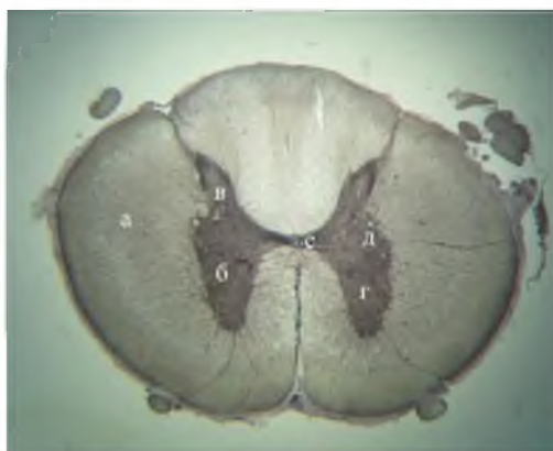
1 - белое вещество; 2 - серое вещество; 3 - дорсальные рога серого вещества; 4 - вентральные рога; 5 - латеральные рога; 6 - спинномозговой канал